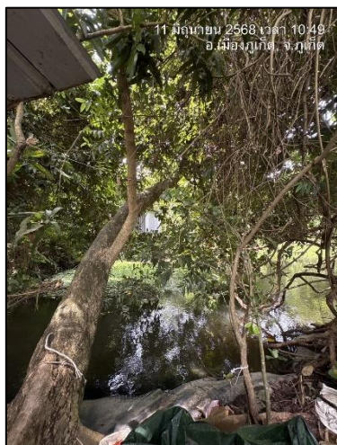
รูปภาพที่ 2.3 อ่างเก็บน้ำ