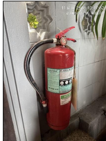
ถังดับเพลิง