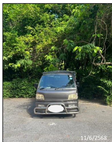
รูปภาพที่ 2.7 รถบริการภายในโรงแรม