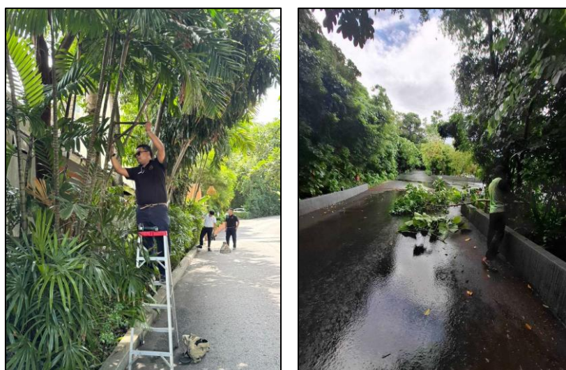
รูปภาพที่ 2.2 คนสวน