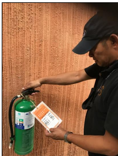
รูปภาพที่ 2.24 การตรวจสอบอุปกรณ์ป้องกันและแจ้งเตือนอัคคีภัย