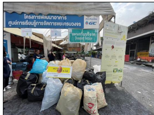
รูปถ่ายที่ 2.20 การร่วมกิจกรรมกับชุมชน