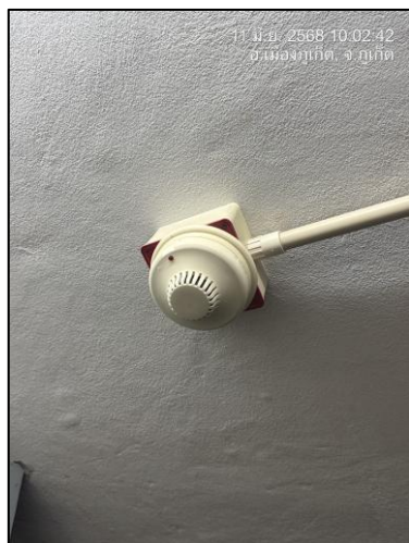
อุปกรณ์ตรวจจับควัน