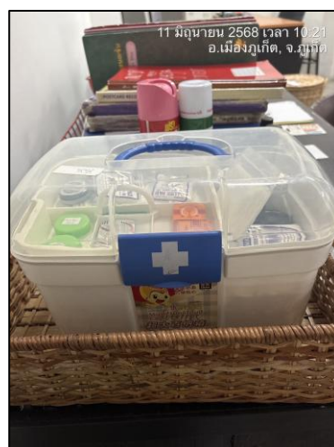
รูปภาพที่ 2.23 กล่องปฐมพยาบาล