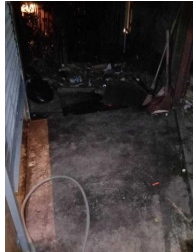
รูปถ่ายที่ 2.18 การล้างทำความสะอาดห้องพักขยะมูลฝอย