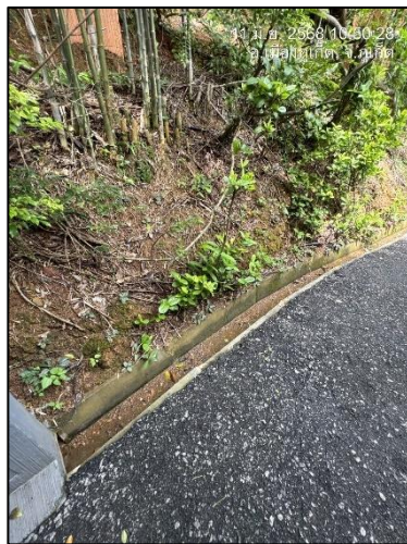
รูปภาพที่ 2.10 รางระบายน้ำ