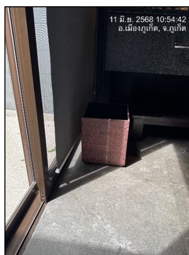
รูปภาพที่ 2.16 ถังขยะมูลฝอยในพื้นที่ต่างๆ ของโรงแรม