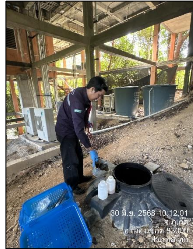
รูปภาพที่ 2.9 ระบบบำบัดน้ำเสียสำเร็จรูปของโรงแรม