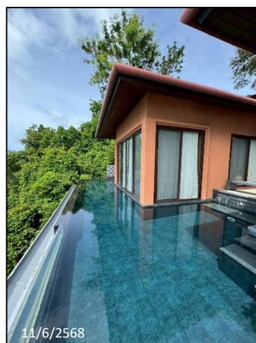
รูปภาพที่ 2.5 ห้องอาหาร สปา และสระว่ายน้ำ