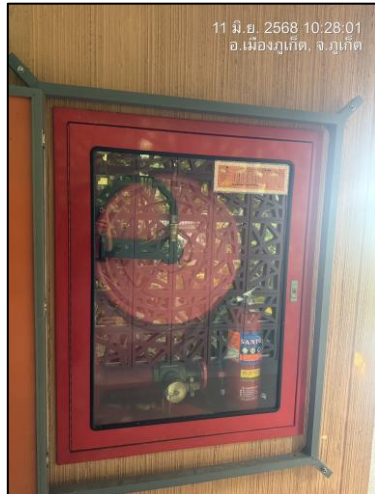
ตู้อุปกรณ์ดับเพลิง