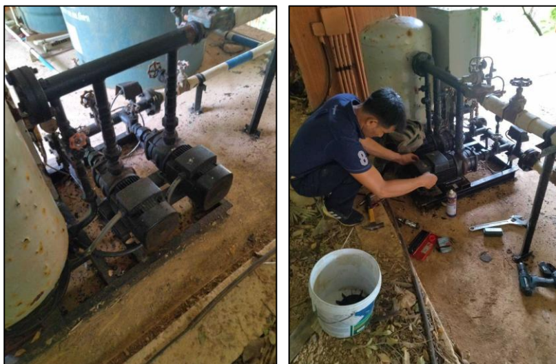
รูปภาพที่ 2.13 การตรวจเช็คเส้นท่อของระบบจ่ายน้ำ