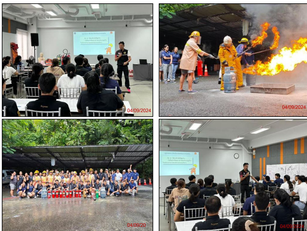
รูปภาพที่ 2.25 การซ้อมอพยพหนีไฟ