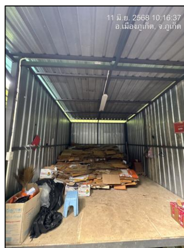
รูปภาพที่ 2.15 โรงคัดแยกขยะ