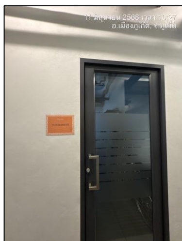
รูปภาพที่ 2.22 ห้องปฐมพยาบาลของโรงแรม