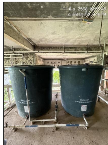
รูปภาพที่ 2.11 ถังเก็บน้ำใช้