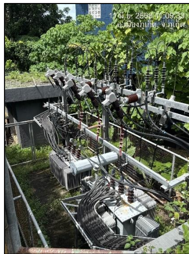
รูปถ่ายที่ 2.19 หม้อแปลงไฟฟ้า