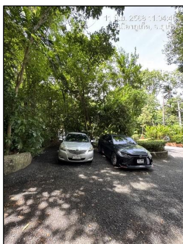
รูปภาพที่ 2.6 ลานจอดรถ