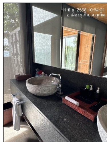
รูปภาพที่ 2.12 สุขภัณฑ์ที่ประหยัดน้ำ