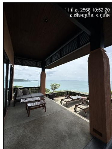
รูปภาพที่ 2.4 โครงสร้างอาคาร