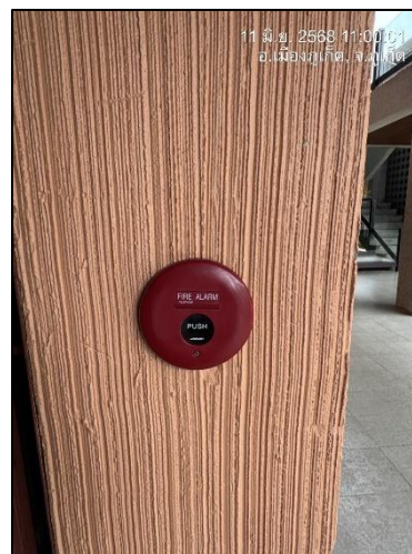
อุปกรณ์แจ้งเหตุเพลิงไหม้แบบเสียงและแสง