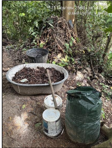
รูปถ่ายที่ 2.17 จุดทำปุ๋ยหมักชีวภาพของโรงแรม